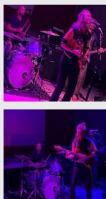
Affiche de la première soirée du vendredi 20 octobre 2023 (à gauche), photos du groupe Muthur lors de cette même soirée (à droite).

Une première soirée réussie s'est tenue le vendredi 20 octobre à la salle des fêtes de Gigouzac avec les groupes toulousains X-Or (chanson punk), 1-up collectif (électro) et Muthur (garage-punk) et le DJ lotois Val Monster (électro funk), qui nous ont fait danser toute la nuit.