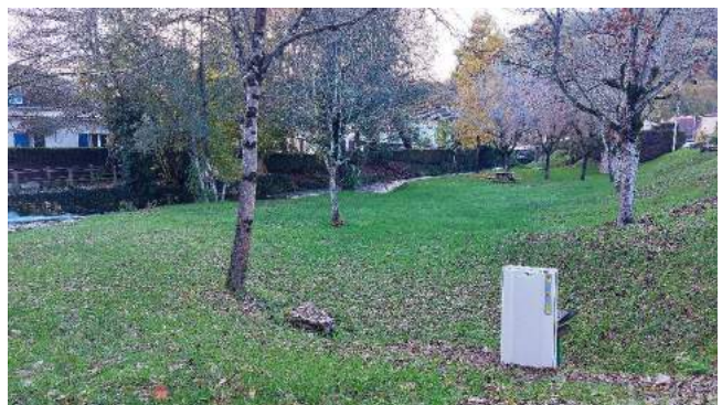
Un compteur électrique a été installé à la Vernière