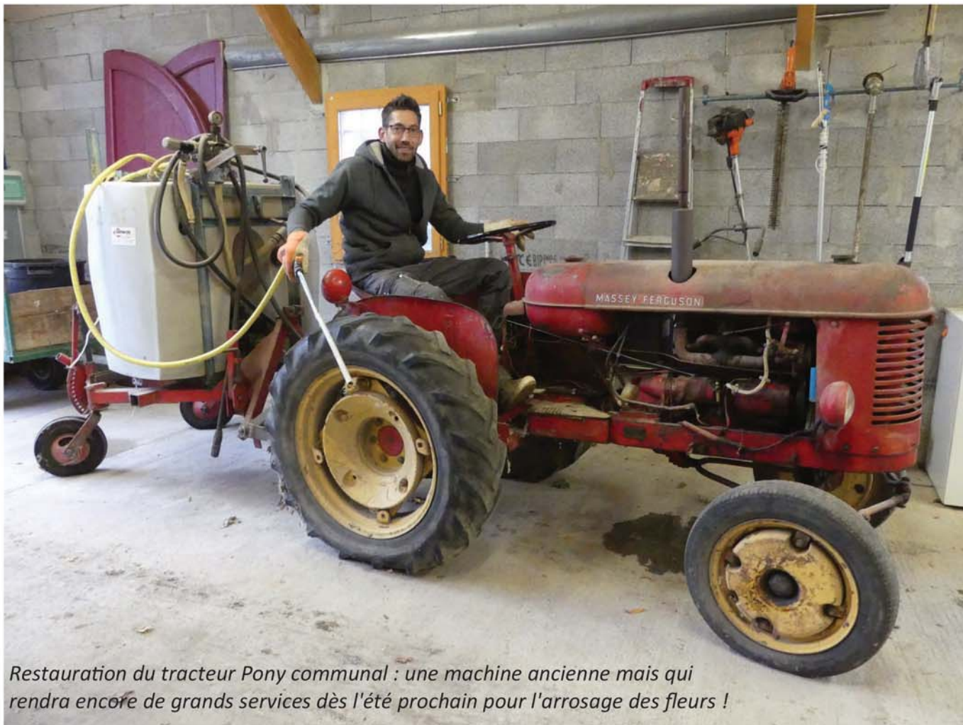
Restauration du tracteur Pony communal : une machine ancienne mais qui rendra encore de grands services dès l'été prochain pour l'arrosage des fleurs !