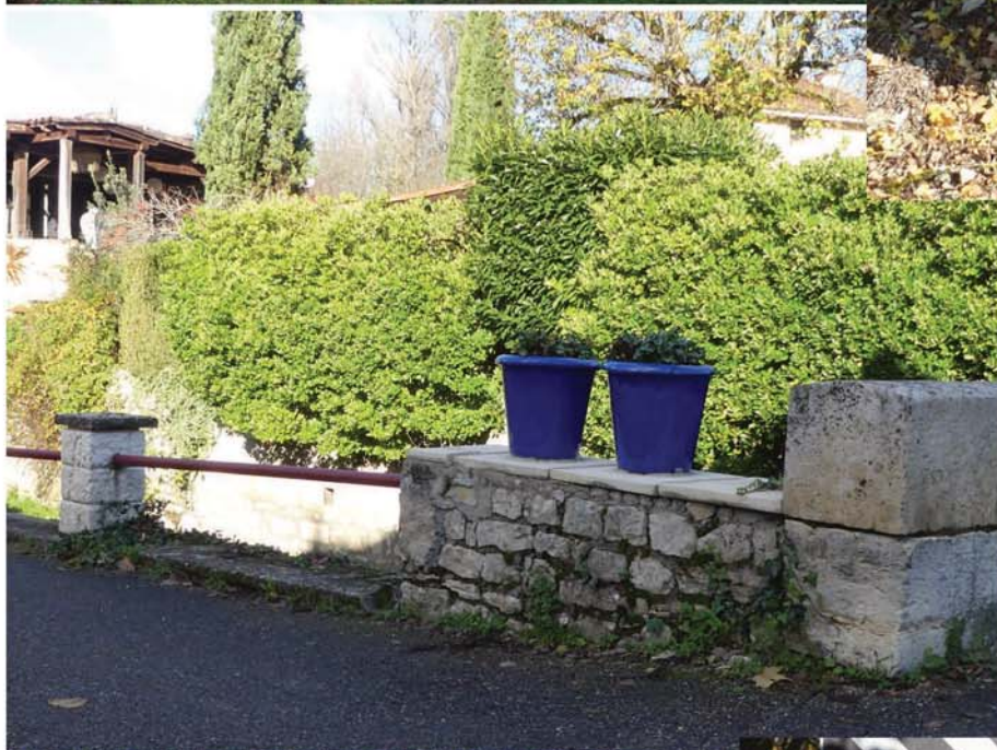
Restauration de l'angle du pont à l'entrée du bourg