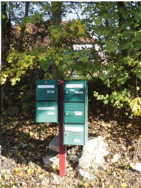
Regroupement des boîtes à lettres du Fajot sur un seul mât