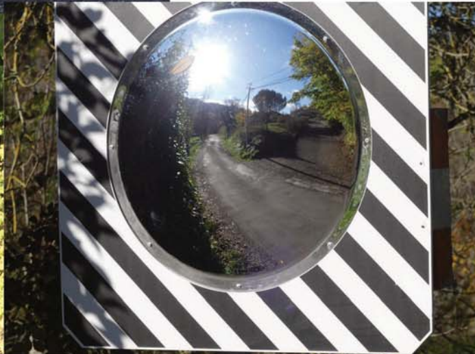
Sécurisation de la sortie des maisons du Fajot avec la mise en place d'un miroir routier