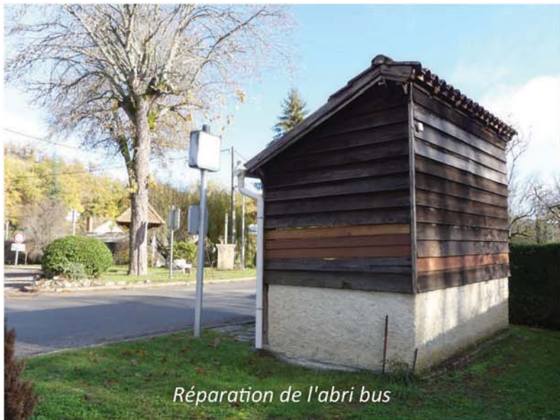
Réparation de l'abri bus