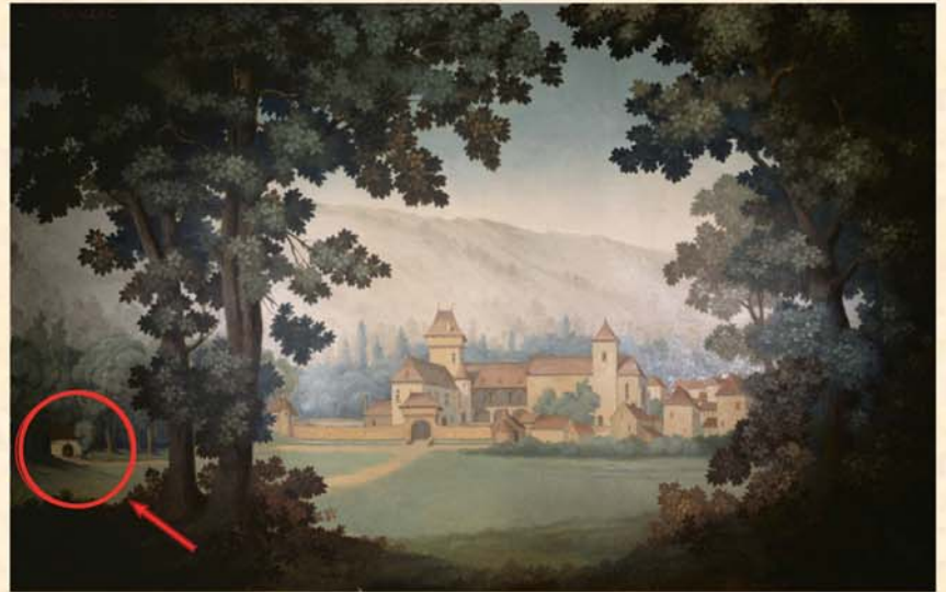
Tableau représentant une reconstitution du château de Gigouzac

En tant que Seigneur de Gigouzac, il conservait plusieurs droits, comme ceux de voirie et de police. En sa qualité de haut-justicier, il conservait également des droits sur les moulins et les fours puisqu'il était seul propriétaire des rivières et des bois. Plus il y en avait, plus la seigneurie était florissante !