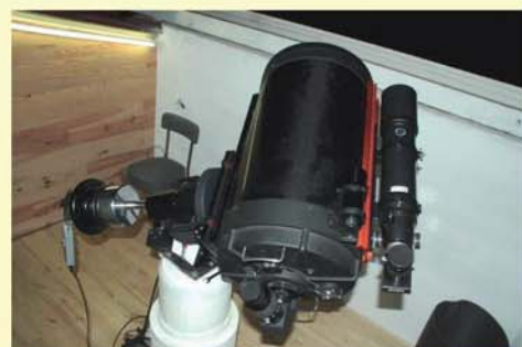
Télescope informatisé C14

http://club-astronomie-gigouzac.over-blog.com/