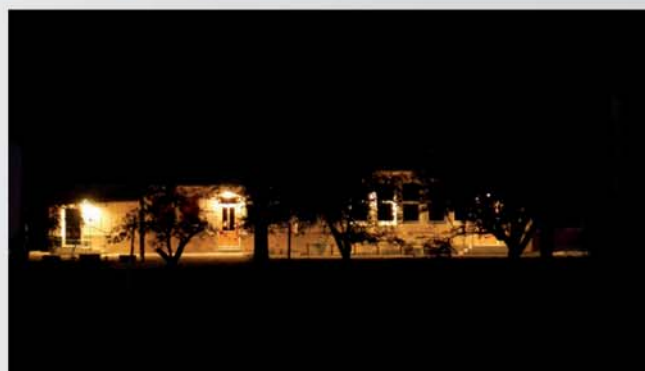
L'école by night !