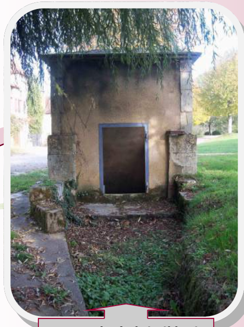
Le Four, à côté de l'école