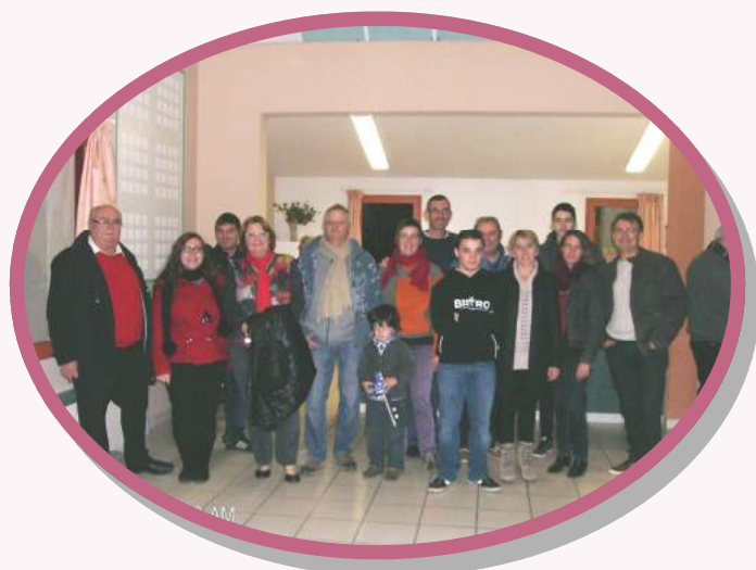
Samedi 28 novembre 2015 : « Nouveaux arrivants »

La cérémonie des vœux se déroulera le samedi 23 janvier, en soirée autour d'un grand buffet comme l'an passé.