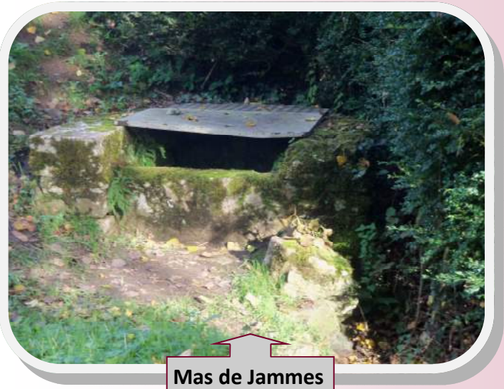
Mas de Jammes