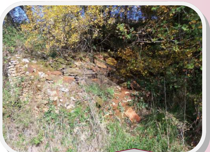
Combe Mas de Jouanis