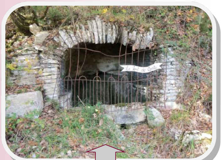
Fontaine de Conti sous Les Pirades